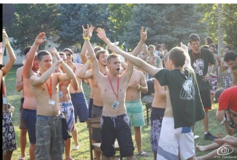
Egy kis kedvcsináló az előző évek gólyatáborából. www.senior.ktk.bme.hu